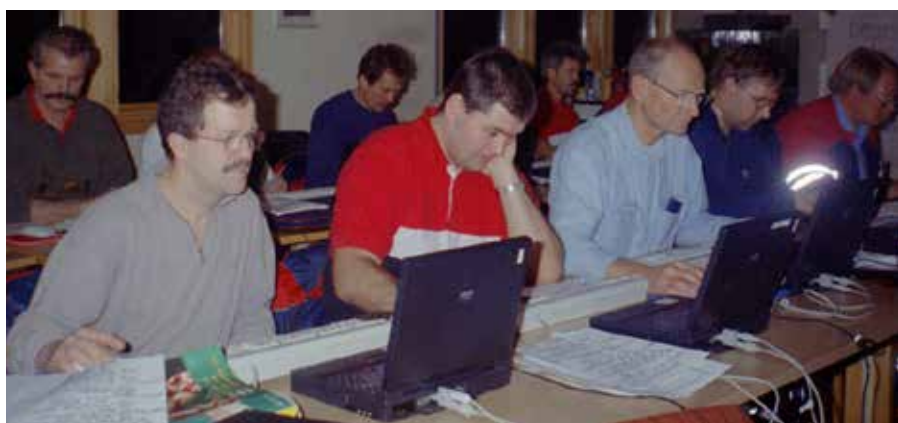
Montørene på Selfors i Mo i Rana deltok på datakurs.

Korneliussen forteller at etter en tid innså okkupantene at fiskeproduksjonen var viktig. Det ble da tillatt å bruke radioforbindelsen, men av frykt for at senderen kunne bli brukt til korrespondanse med fiendtlige skip, ble senderrøret demontert og tatt med av soldaten som ved sendetid igjen møtte opp med radiatorøret.